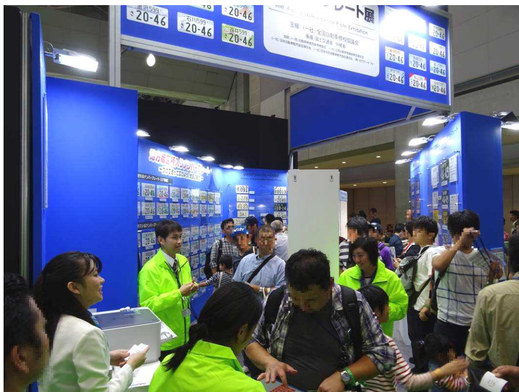
希望番号申込サービス体験コーナー①