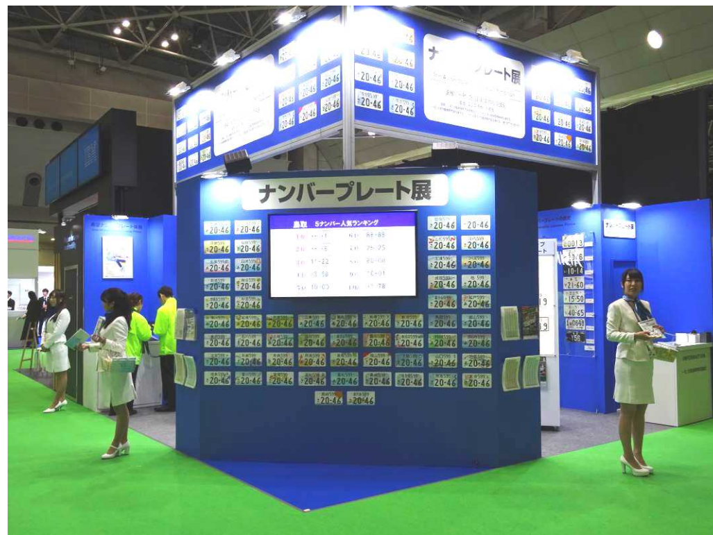
第46回東京モーターショー2019 ナンバープレート展