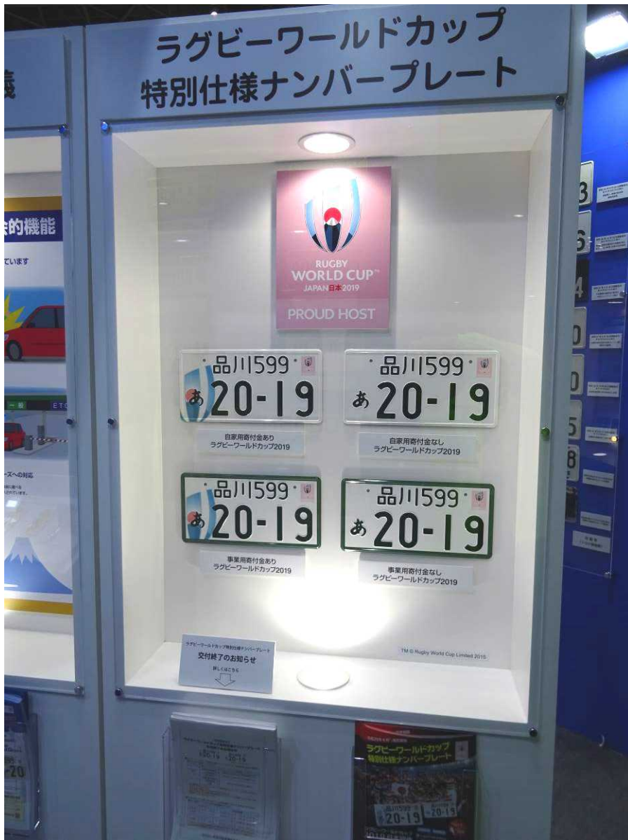
TM © Rugby World Cup Limited 2015