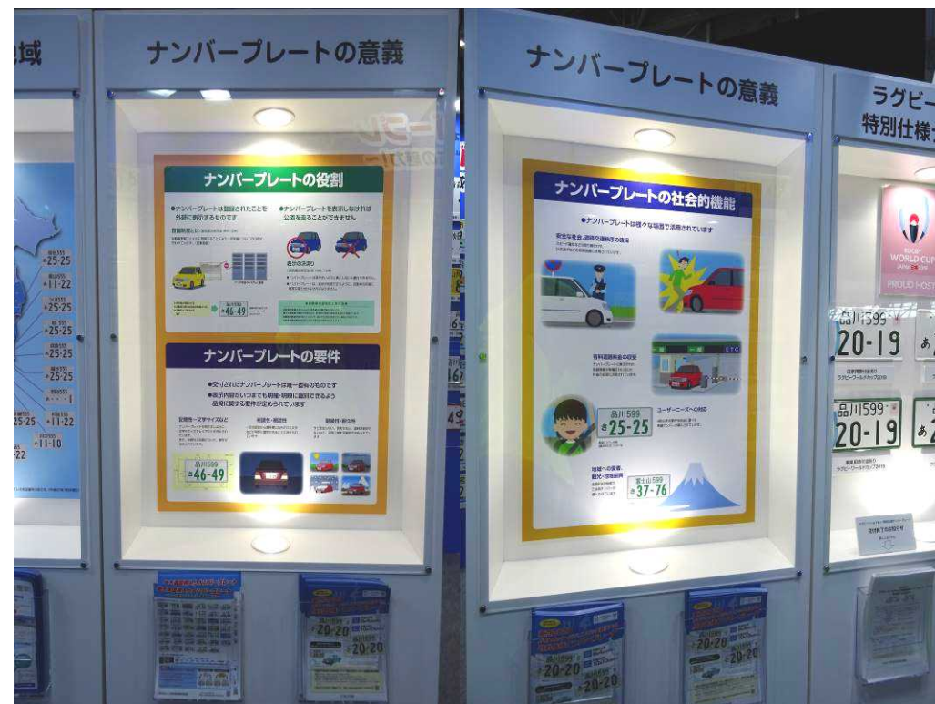
ナンバープレートの役割、要件、社会的機能の説明パネル