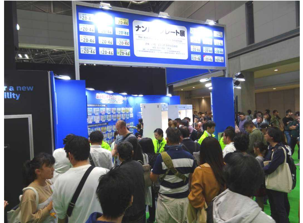
来場者で賑わうブース②