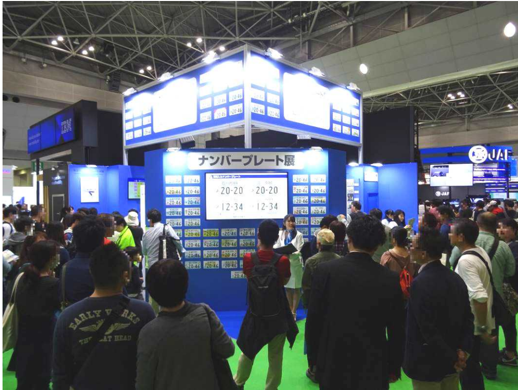
プレゼンテーションステージ①