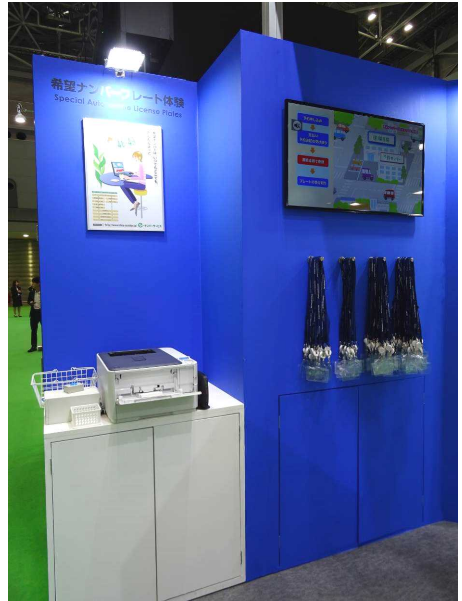
希望番号申込サービス体験コーナーと 希望ナンバープレート紹介ビデオ