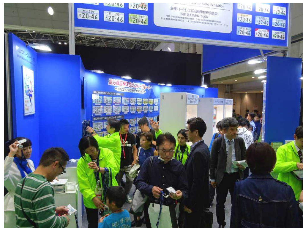
希望番号申込サービス体験コーナー②