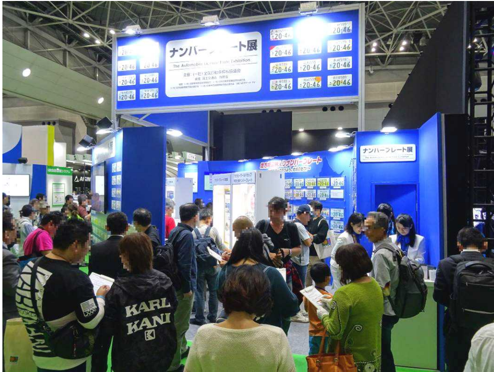
来場者で賑わうブース①