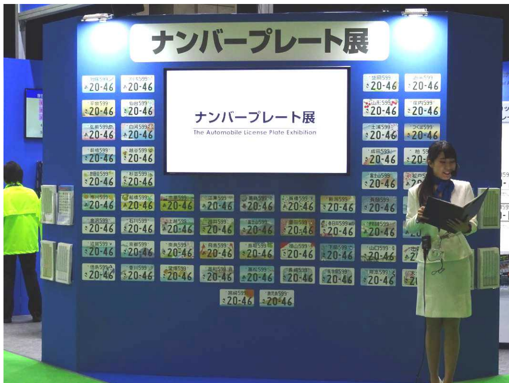
プレゼンテーションステージを設けたナンバープレートの展示