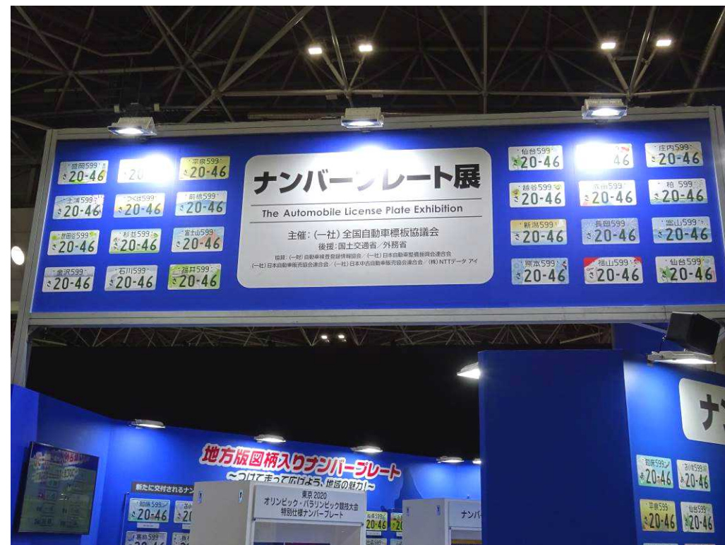
国土交通省及び外務省の後援、関係団体等の協賛により実施