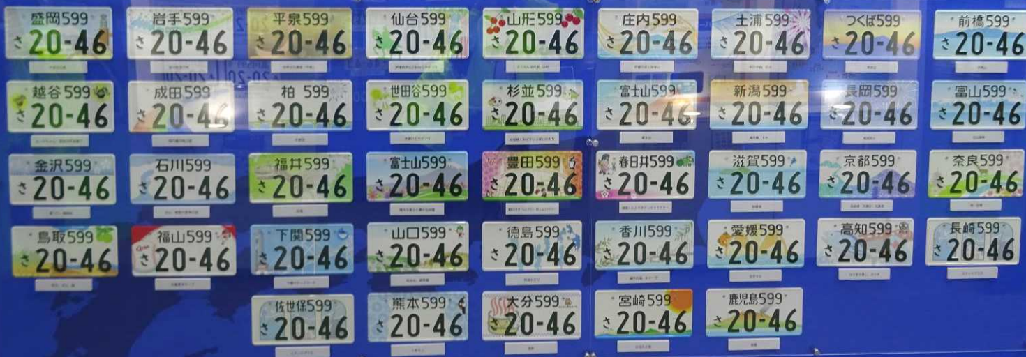
地方版図柄入りナンバープレートの展示