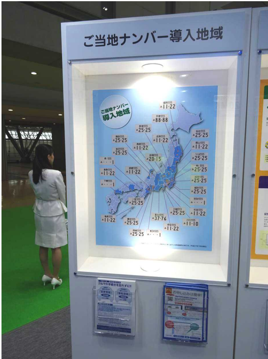
ご当地ナンバーパネルの展示