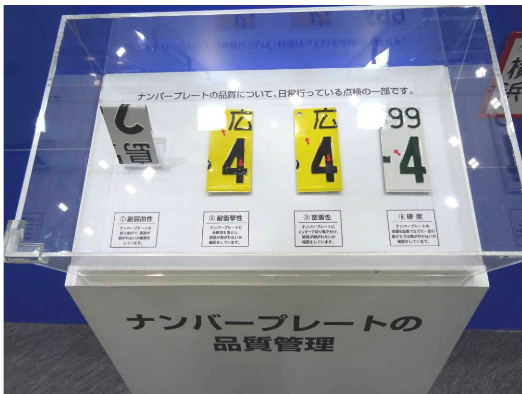
品質について標板製作者が日常行っている点検の一部の展示