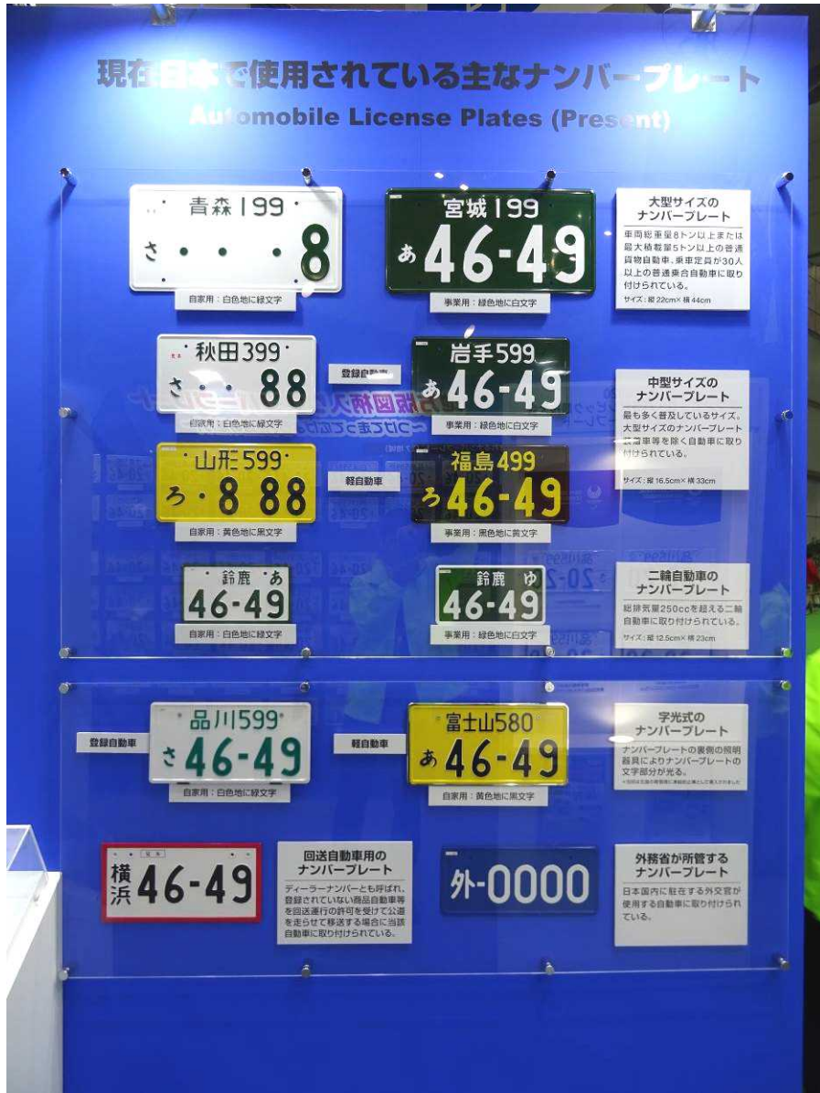
現在日本で使用されている主なナンバープレート