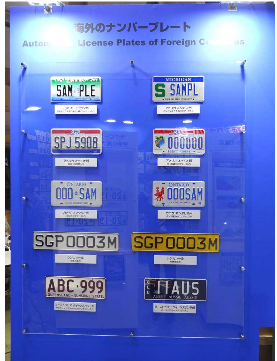
海外のナンバープレートの展示