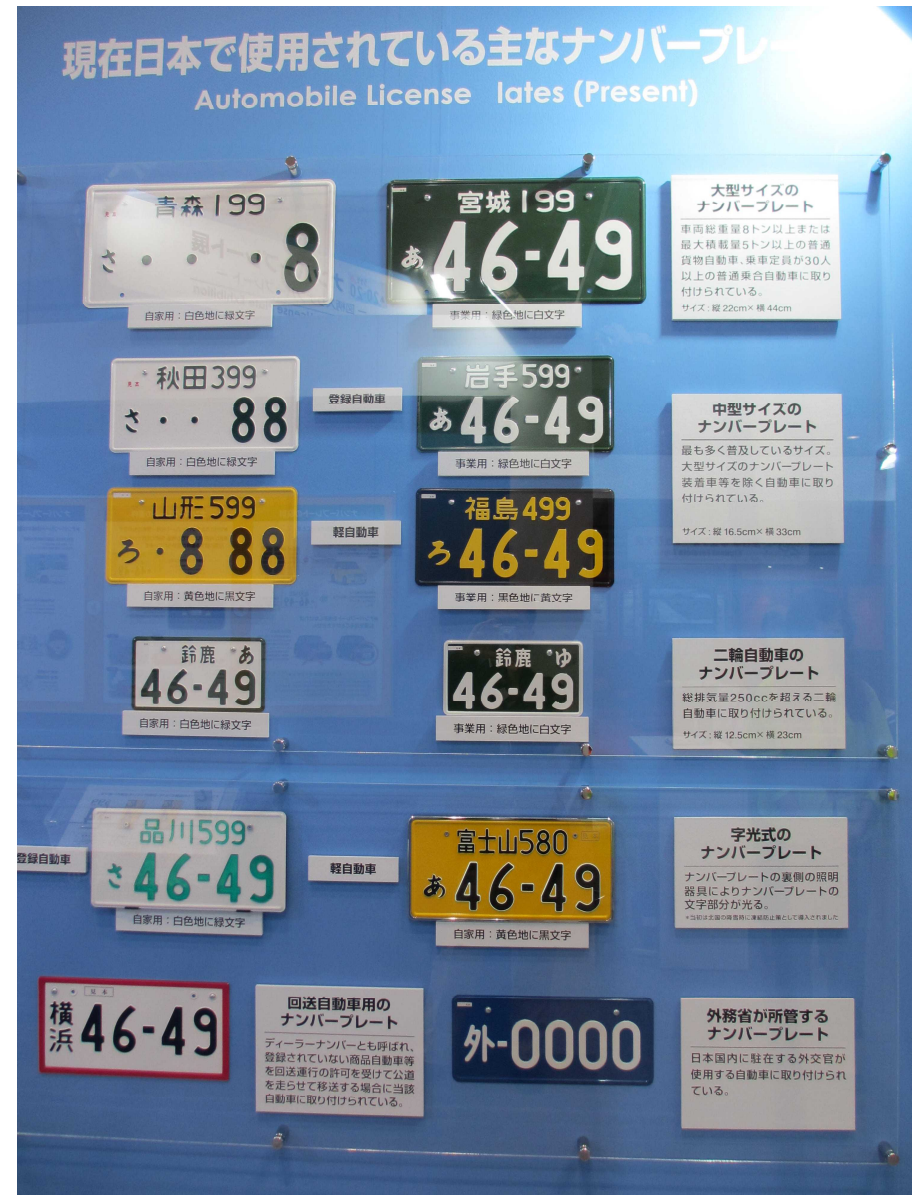
現在日本で使用されている主なナンバープレート