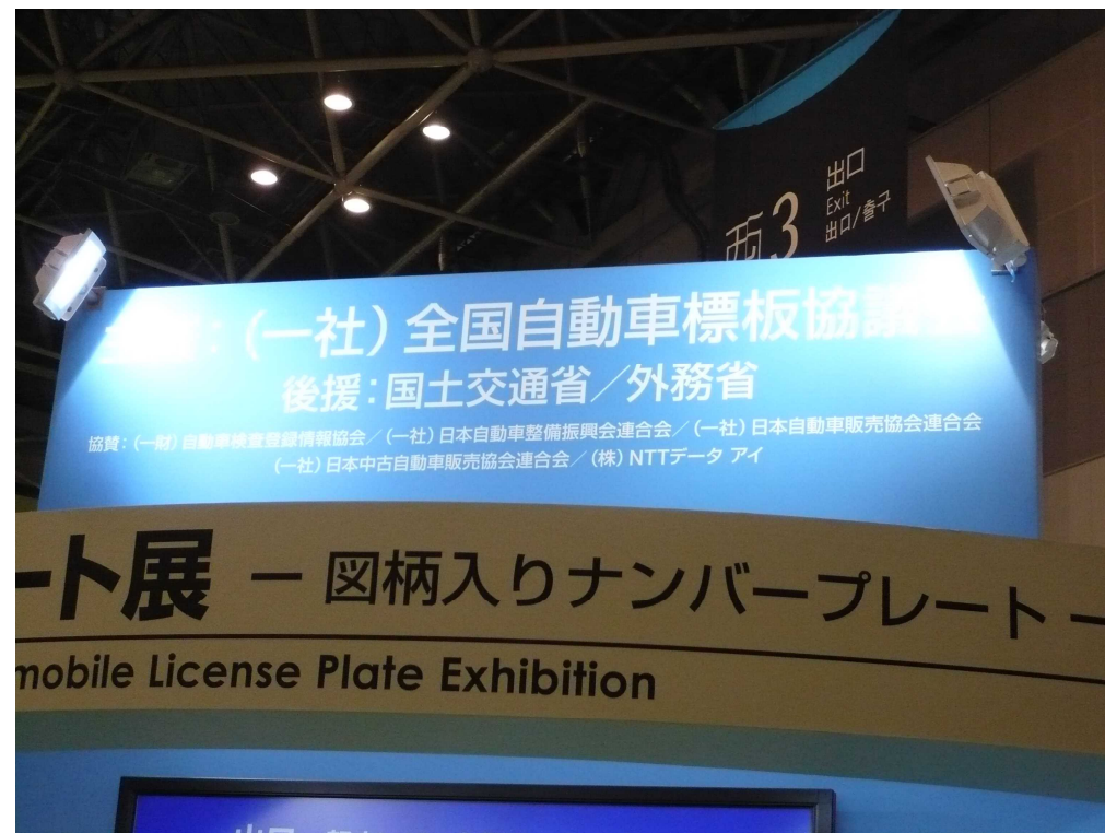
国土交通省及び外務省の後援、関係団体等の協賛により実施