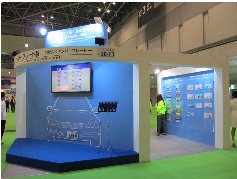
プレゼンテーションステージを設けたナンバープレートの展示