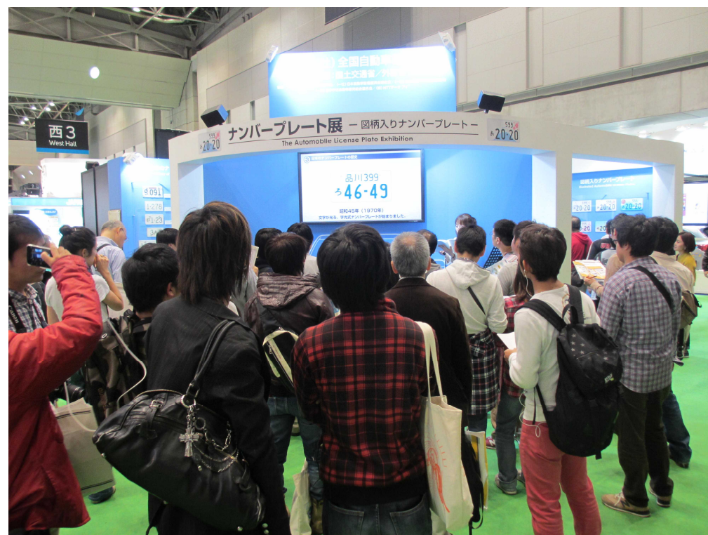
プレゼンテーションステージ