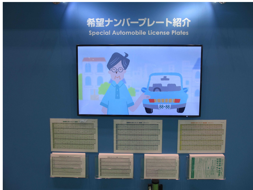
希望ナンバープレート紹介ビデオと 希望ナンバー人気ランキング表の配布