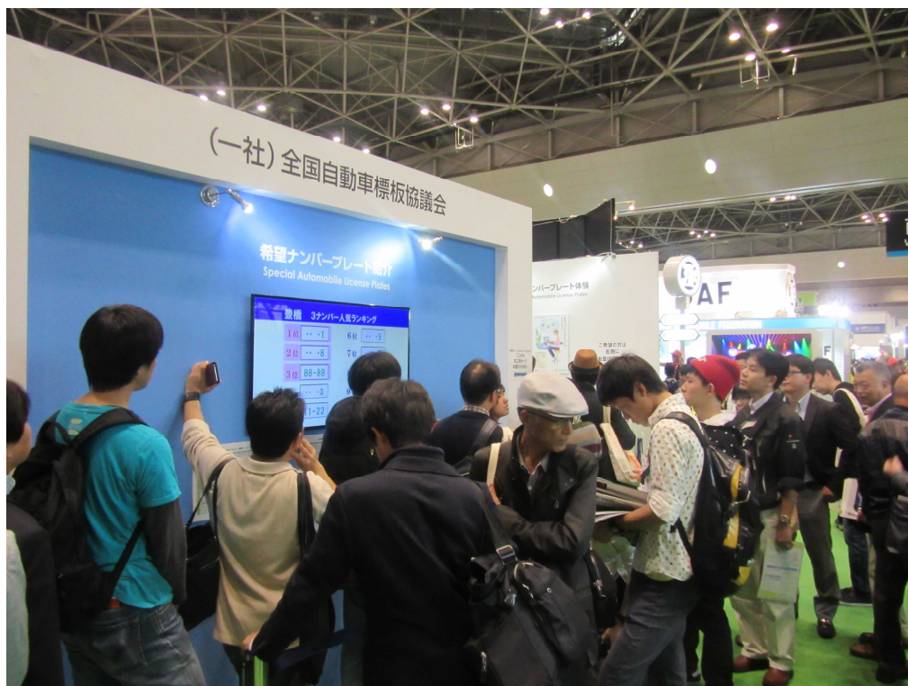
希望ナンバー申込み体験に来場者の列