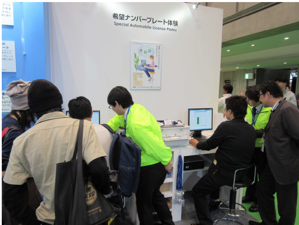
希望ナンバー申込み体験コーナー