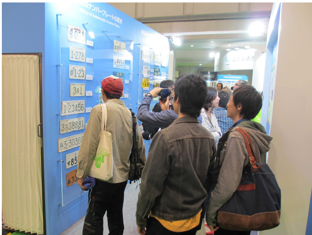
来場者で賑わうブース