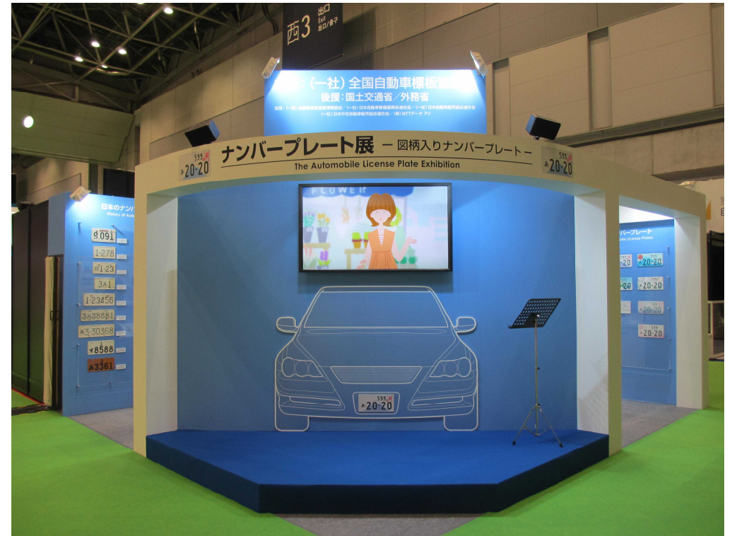
第44回東京モーターショー2015 ナンバープレート展