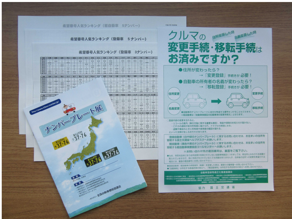
配布した小冊子、ランキング表、リーフレット