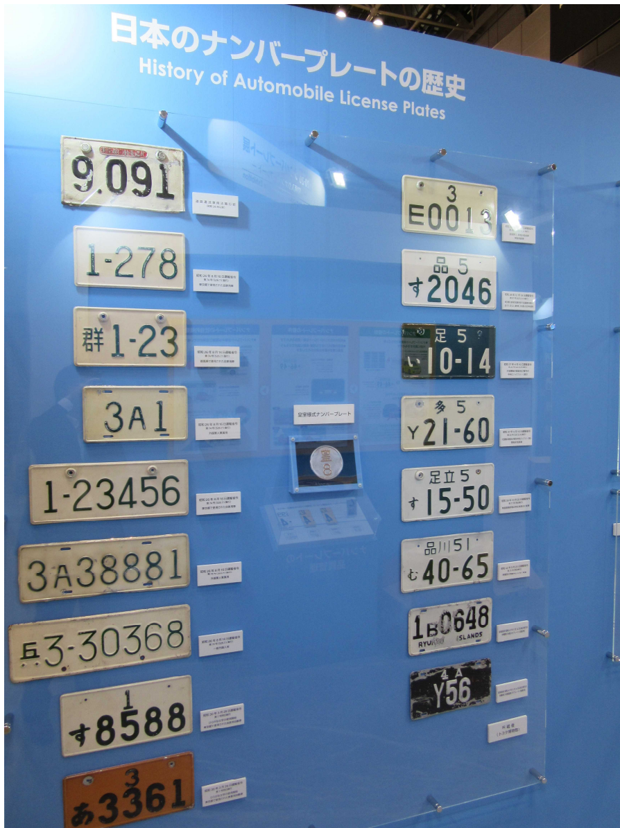
日本のナンバープレートの歴史