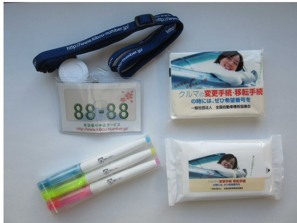
各コーナー等で配布したノベルティグッズ